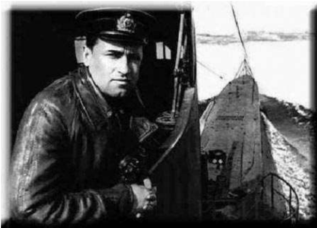
2008 – Государственная Дума утвердила кандидатуру Путина на пост премьер-министра.