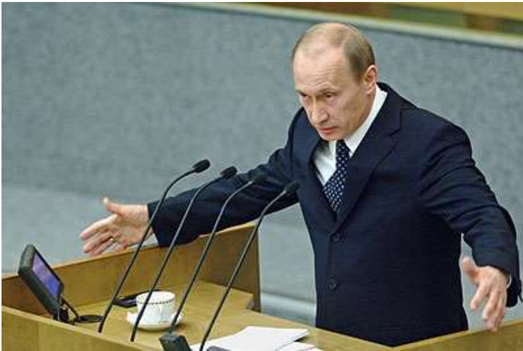
2012 – Дмитрий Медведев утверждён на посту председателя правительства России.