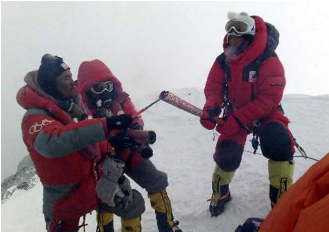
2015 – Киргизия присоединилась к Евразийскому экономическому союзу.